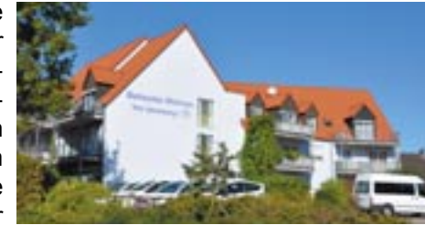
Betreutes Wohnen „Am Jakobsweg“

ist eine kleine Wohnanlage für rüstige Senioren, die selbstständig wohnen und trotzdem bei Bedarf die Angebote der Diakoniestation