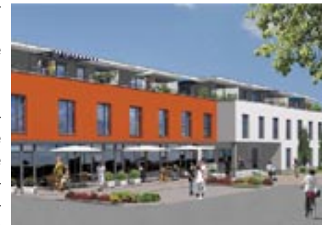
Rangau Seniorenresidenz &- zentrum

Voraussichtlich im Frühjahr 2011 wird das Betreute Wohnen Rangau Seniorenresidenz &- zentrum in Oberasbach bezugsfertig sein. Das Diakonie Fürth kann in dem neuen Haus die ambulante Pflege und weitere Dienstleistungen übernehmen. Außerdem wird sie drei Wohngruppen für demenziell erkrankte Menschen mit insgesamt 39 Plätzen anbieten.